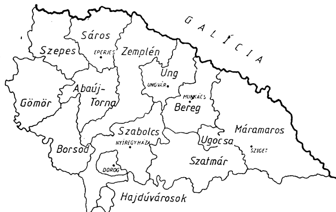
A Munkácsi Egyházmegye joghatósága alá tartozó vármegyék 1806-ban

Gennadius elhunytát követően a munkácsi egyházmegye területén fekvő monostorok ihumenjei Pazin Gedeon kisbereznai házfőnököt protoihumenné választották. A magyarországi rutén bazilita rendi monostorok ekkortól szerveződnek szabályos, önálló rendtartománnyá. A XVIII. század folyamán a rend több iskolatípust is fenntartott. Az 1770-es évektől Máriapócson teológiai és filozófiai kurzus folyt, ekkortájtól működött itt a rend egyetlen világiakat is tanító intézménye, ahol az ismeretszerzésnek kétféle útját kínálták: a grammaticalis és urbano-nacionalis iskolában történő tanulást. 10