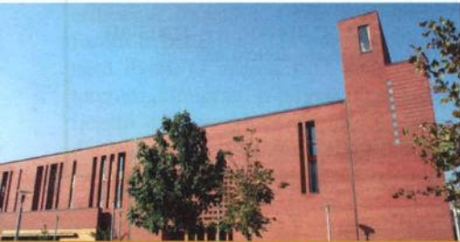
Szeptembertől indul a kántor szak