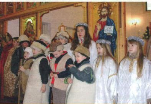
Szirmabesenyői Görög Katolikus Egyházközség