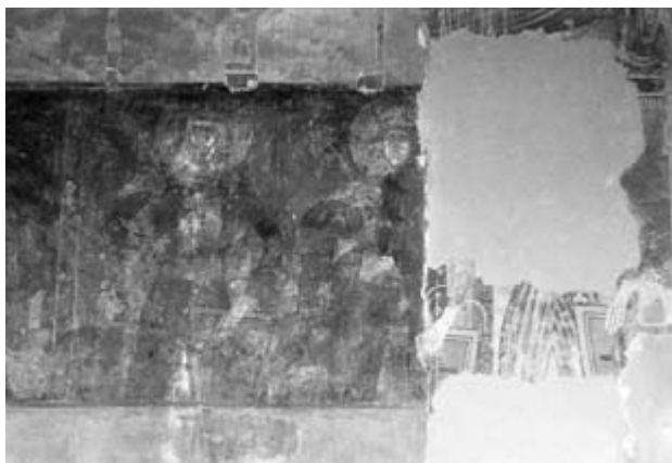
2. Ismeretlen festő: A magyar szent királyok együttése, 1417 Falkép. Ribiča, orthodox templom.