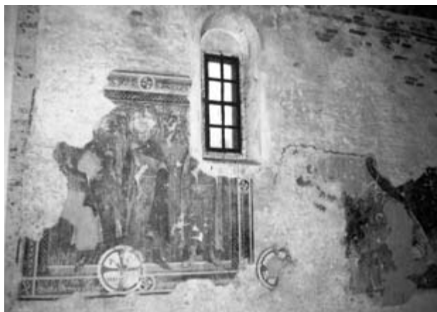
3. Ismeretlen festő: A magyar szent királyok együttese, XV. század első fele Falkép. Chimindia, református templom

sába nem érdemes belemenni. Mindenesetre Kristyór, Ribice és Kéménd freskói arra intenek, hogy ennek a többnemzetiségű vidéknek a kutatása során érdemes mellőzni a felekezeti-etnikai hovatartozás megszokott, leegyszerűsítő összekapcsolását, 21 mivel az együttélés során a különböző nyelvű és vallású közösségek olyan összetett kulturális jelenségeket hoztak létre, amelyeket nem lehet egyszerűen csak a szokványos klisék alapján leírni és értelmezni.