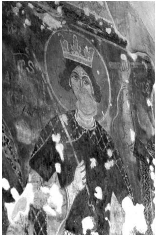
1. Ismeretlen festő: Szent Imre alakja a három magyar királyszent együtteséből, XV. század első évtizede Falkép. Crișcior, orthodox templom.

szentjének, Miklósnak térdelve nyújtják át az egyház modelljét, megjelenítették továbbá az egyikük feleségét és kislányát, az előbbit a férfiak mögött, az utóbbit a templom modell alatt találjuk meg. A jelenet nyugati vége elpusztult, lehet, hogy még több szereplő is volt rajta. Velük szemben,